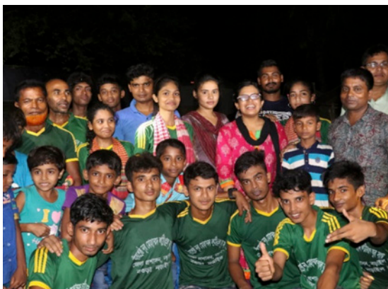
Figura 2 Grup de Lathi Khela de Narail.

En tots els districtes, fins ara, les dones se situaven d'una certa manera, incloent-me a mi. Principalment en les seues llars domèstiques o acompanyades pels seus homòlegs masculins com a membres del públic. Al districte de Netrokona, a les dones encara no se'ls permetia eixir del Purdah, la cortina que marca el límit entre la sala d'estar i la cuina. Els homes tampoc entraven en aquest espai de la cuina. Recorde entrar a aquest espai de la cuina, i em feien moltes preguntes, els parlava de la meua àvia i esclataven en riallades, però no massa fortes i amb timidesa. Una d'aquestes dones, l'esposa del líder, va entrar momentàniament al saló mirant cap avall, evitant el contacte visual, i em va servir l'esmorzar amb els homes de la casa al seu llit.