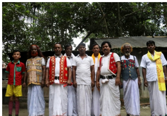
Figura 1 Practicants de Lathi Khela de diferents districtes en les zones rurals de Bangladesh. Dalt: Grup Manikganj; enmig: Grup Netrokona; baix: Grup Kishoreganj.